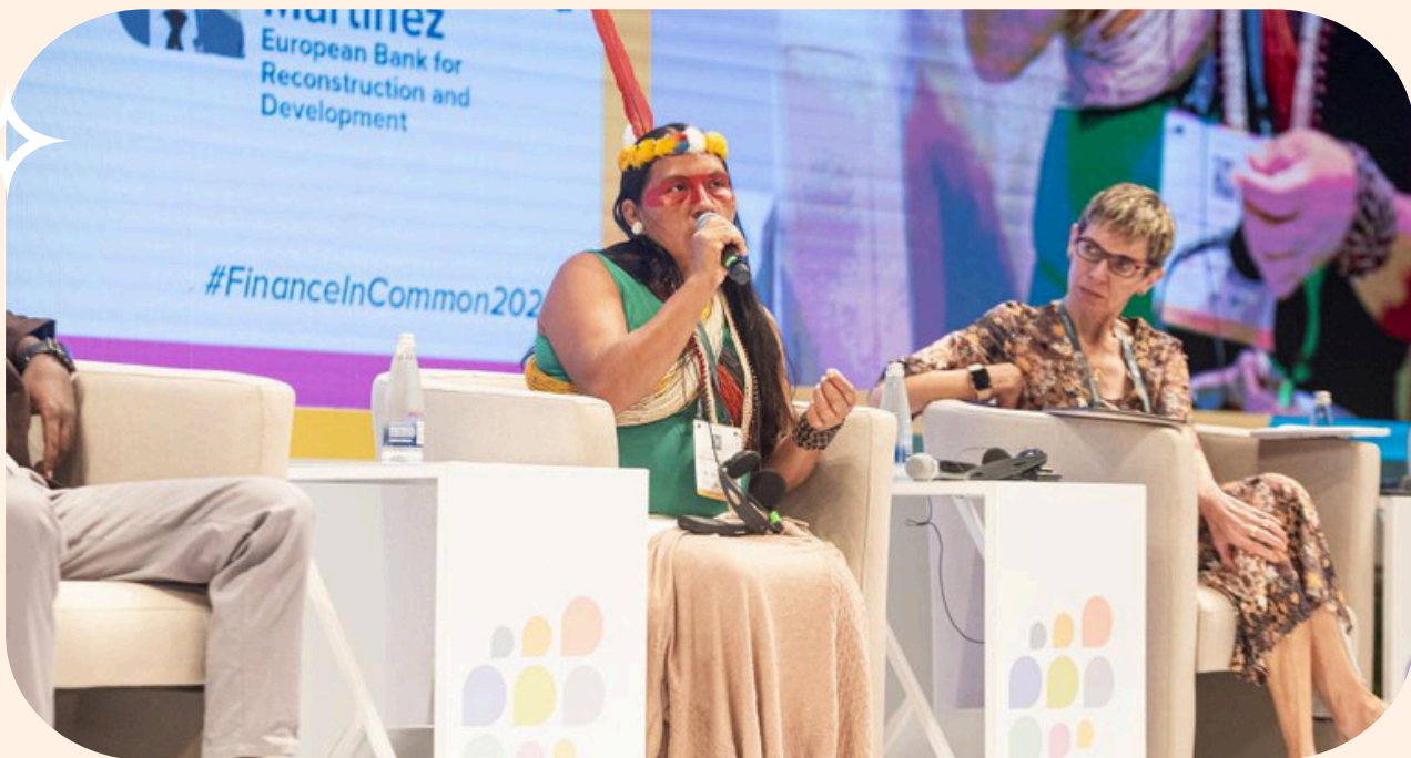
©Finanzas en Común- Cumbre Finanzas en Común 2023 - Organizada por el BID, Bancoldex y ALIDE