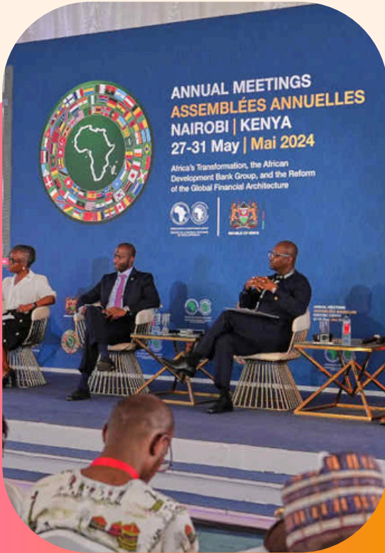
©Reunión anual de la AFDB