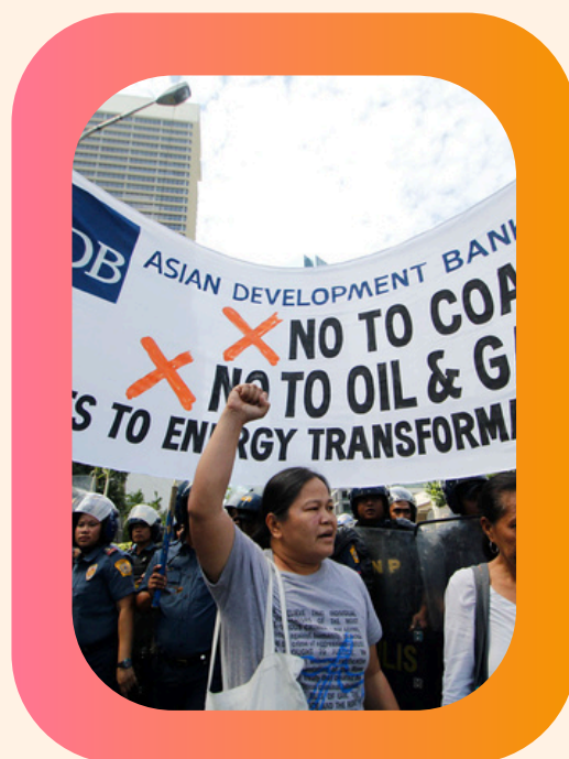
acción pública en Filipinas