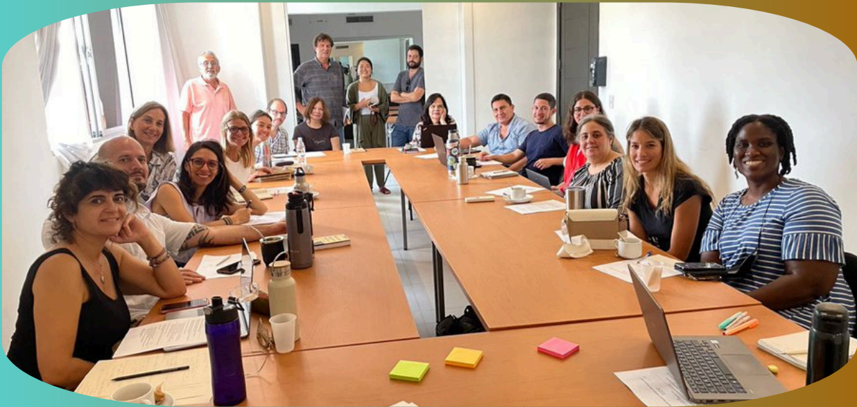
©CHRD joined 20+ civil society groups and affected communities at the #IDBAnnualMeeting, raising independent voices to demand #IDBGroup respect human rights in its projects.