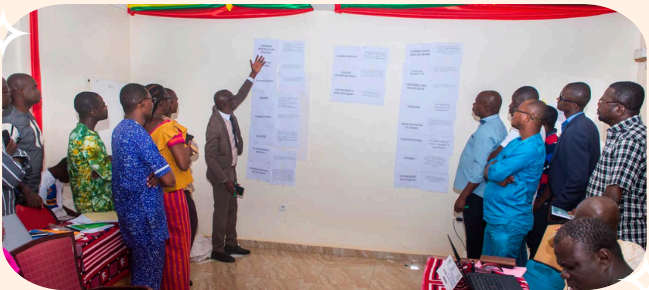
La sociedad civil en las Reuniones Anuales del BAfD. Mayo de 2024, Nairobi.