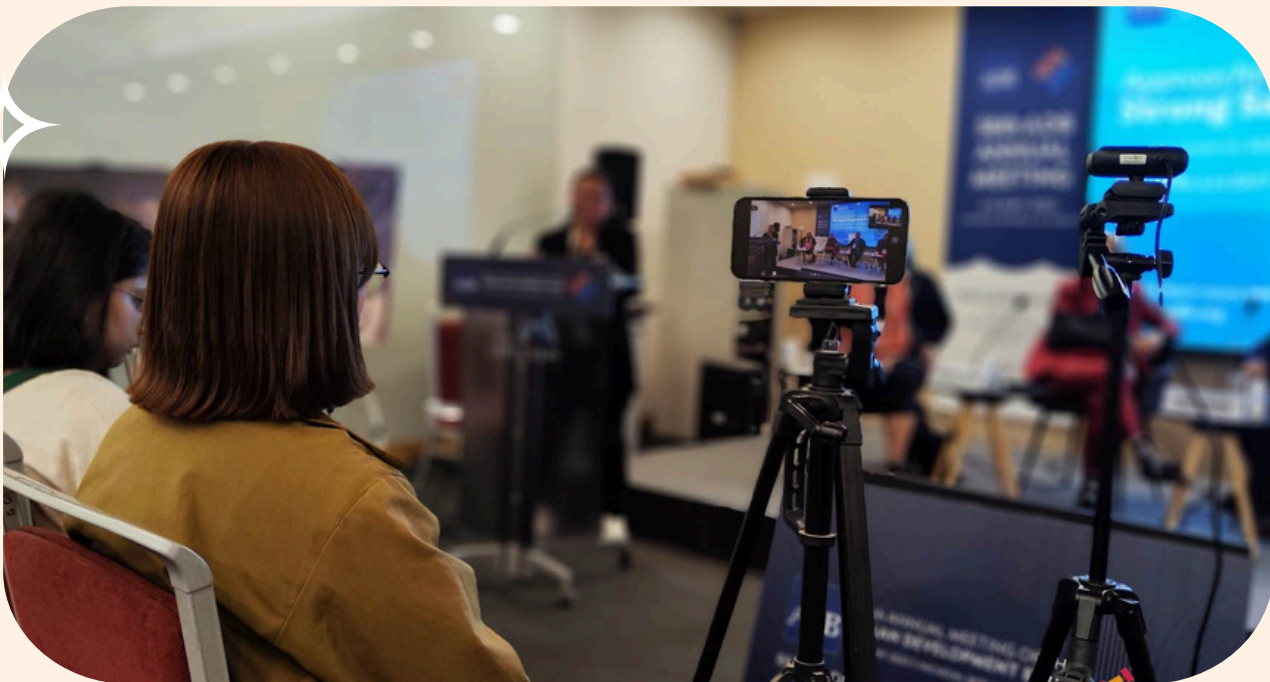
Reunión anual del Banco Asiático de Desarrollo (BAsD), Corea del Sur