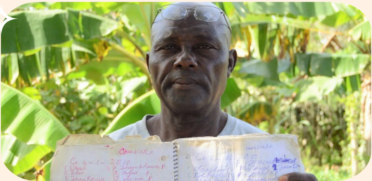
Los agricultores haitianos desplazados por el Parque Industrial de Caracol, con el apoyo de Accountability Counsel y sus socios, lograron un acuerdo histórico para restablecer sus medios de subsistencia

Accountability Counsel fue muy activo en su participación con el MICI entre 2009-2014 en su Proyecto de Directrices para la Fase de Consulta y el Proyecto de Términos de Referencia para la Lista de Expertos Facilitadores del Proceso, haciendo una serie de presentaciones. 162 En 2018, Accountability Counsel y sus socios presentaron comentarios sobre el borrador de las Directrices de la Fase de Consulta desarrolladas por el MICI para estandarizar su enfoque de la fase de consulta de acuerdo con los requisitos de sus políticas, y garantizar una gestión ética, transparente y eficaz de los casos. 163 Las directrices aprobadas en 2018 incorporaron gran parte de las aportaciones de Accountability Counsel. Esto incluye, pero no se limita a, cambios que reflejan que durante un proceso de fase de consulta, las partes deben recibir un trato imparcial y justo, en lugar de un trato igualitario.