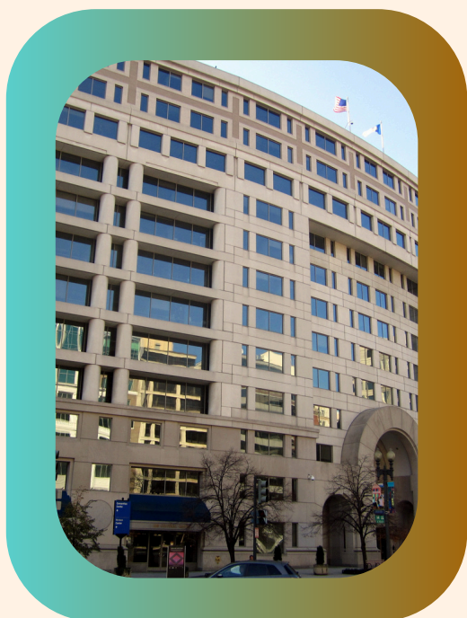
Sede del BID