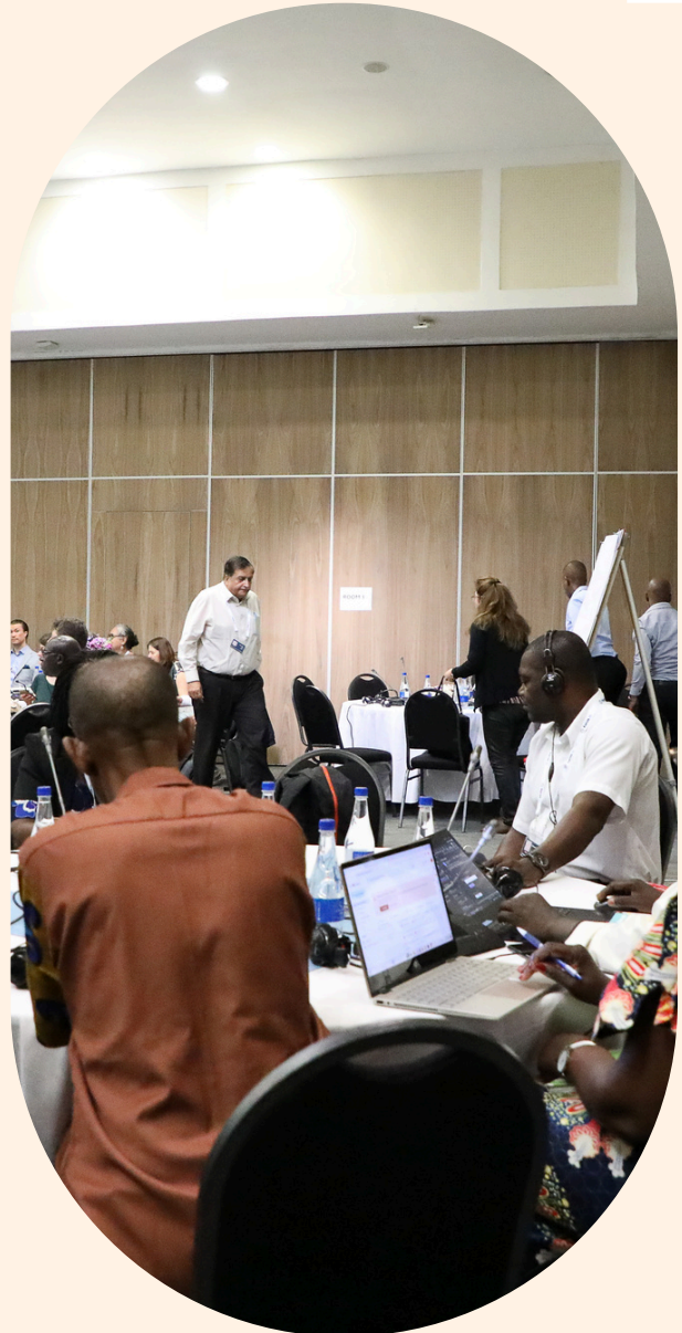
© Asamblea General de Forus 2024, Botsuana

Por último, nos gustaría dar las gracias a las siguientes organizaciones y fotoperiodistas por proporcionar imágenes y elementos visuales para el informe: NNNGO, NGO Forum on ADB, Sanjog Manandhar, Both Nomads, ADB, AfDB, 350.org, Flickr, Human Rights Watch, Finance in Common, CHDR.