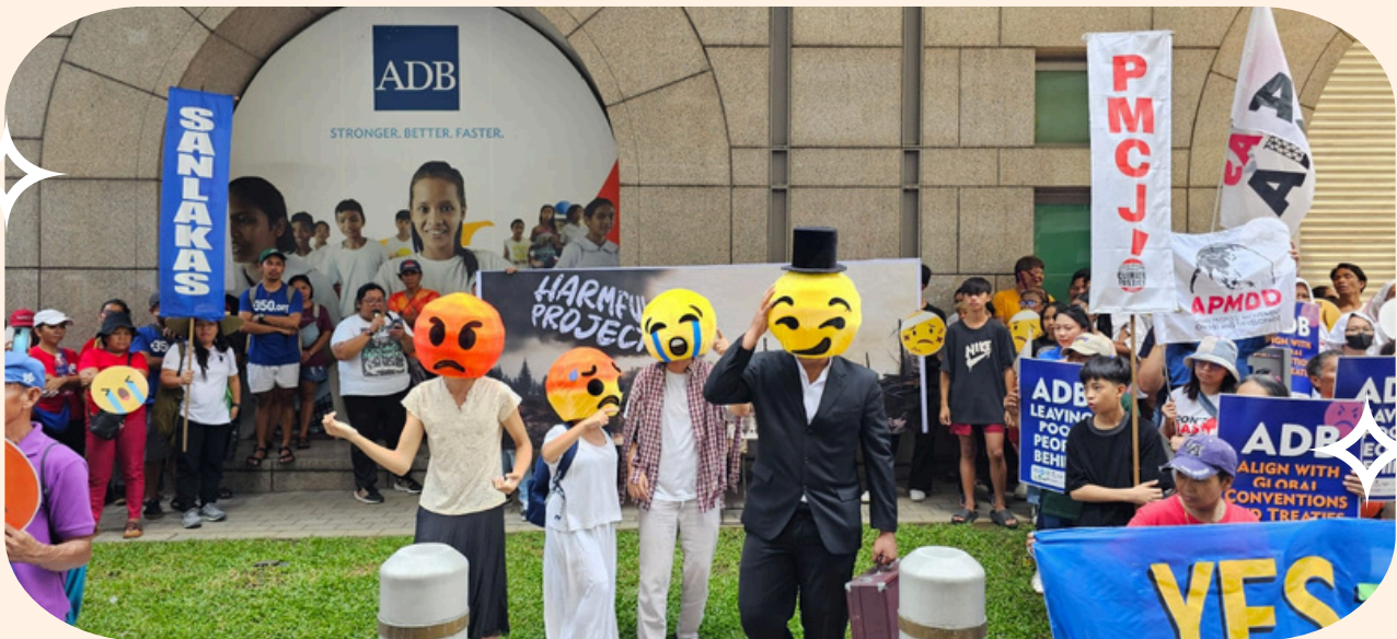
Protesta del FSE ante el BAsD