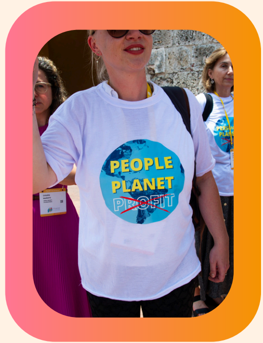
Cumbre 2023 de Finanzas en Común

En la actualidad hay más de 533 Bancos Públicos de Desarrollo (BPD) o Instituciones Financieras de Desarrollo en todo el mundo, con más de 23 billones de dólares en activos y que operan en más de 155 países . Los BPD son algunos de los actores más poderosos del mundo, ya que operan en la intersección de las finanzas y la política. Los BPD son instituciones financieras estatales cuyo propósito es cumplir los objetivos 2 de las políticas públicas. Esto significa que a menudo tienen un firme mandato de desarrollo. Lo ideal sería que destinaran la financiación a donde más se necesita, tuvieran normas sociales y medioambientales responsables y tuvieran en cuenta las cuestiones de género. Deben tener políticas de transparencia sólidas que permitan el acceso público a la información, y debe haber una colaboración significativa con la sociedad civil. También deben estar aislados de las presiones políticas y empresariales . 3