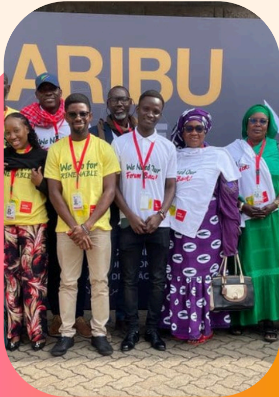
La sociedad civil en las Reuniones Anuales del BAfD. Mayo 2024, Nairobi.