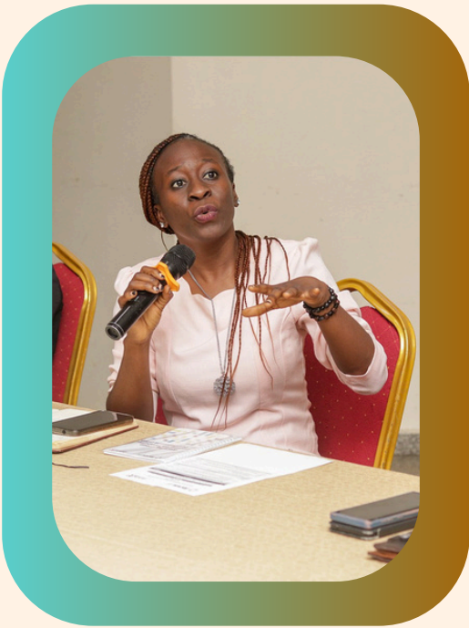
©Proyecto de la Red de ONG de Nigeria para reforzar el diálogo entre las OSC y los BPD