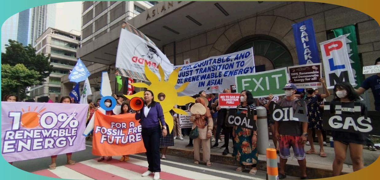
Protesta del FSE ante el BAsD