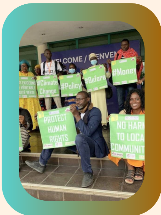
Grupos de la sociedad civil al margen de las Reuniones Anuales del BAfD