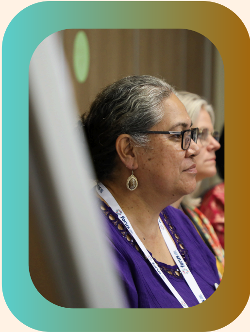
© Asamblea General de Forus 2024, Botsuana